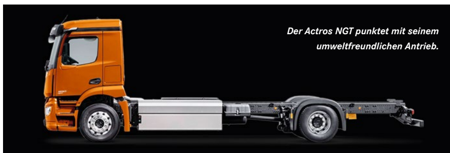
Der Actros NGT punktet mit seinem umweltfreundlichen Antrieb.

Innovative Funktionalitäten werden vom neuen, intuitiv bedienbaren Multimedia-Cockpit aus gesteuert. Zwei zehn Zoll große Farb-Displays ersetzen das klassische Kombiinstrument. Hinter dem Lenkrad liegt das Primärfahr-Display, rechts davon vereint ein Touchscreen die Funktionen des herkömmlichen Schalterfeldes. Also gilt auch für das Innenleben des Actros: schwer zukunftsorientiert.