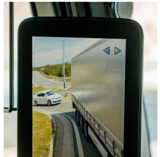
Oben: Die MirrorCam ist das Erkennungszeichen des neuen Actros. Unten links: Abstandslinien helfen beim Blick auf den rückwärtigen Verkehr. Unten rechts: Beim Abbiegen schwenkt die Kamera mit.