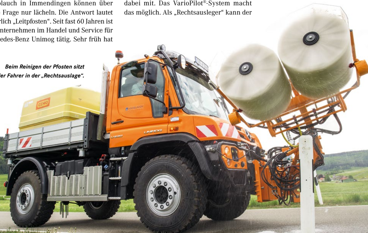
Beim Reinigen der Pfosten sitzt der Fahrer in der „Rechtsauslage“.

Die rollende Waschanlage spart aber nicht nur Kraftstoff, sondern geht auch mit dem Waschwasser sparsam um. Dank einstellbarer Düsen und Spritzschutz gelangt das Wasser direkt an den Leitpfosten. Die Mulag Doppelwaschbürste des Typs DWB weist eine Waschbreite von 80 Zentimetern auf und bringt neben Leitpfosten auch Verkehrsschilder und Schutzplanken wieder auf Glanz.