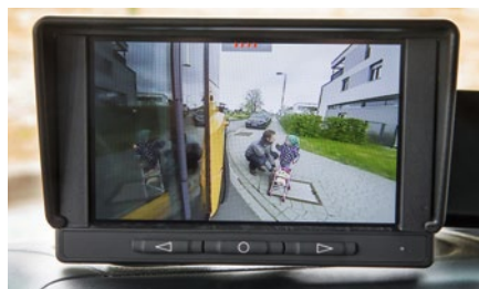
Das Totwinkel-Kamerasystem (TKS) rechnet den Bewegungsentwurf des Fahrzeugs mit ein.

Überall dort, wo der Fahrer nicht hinsieht, hilft das Totwinkel-Kamerasystem (TKS) des Econic. Zu dem optionalen System gehören vier Kameras – nach jeder Seite eine. Die intelligent gesteuerten Kameras reagieren auf den Lenkwinkelsensor und den Blinker und zeigen dem Fahrer immer den Ausschnitt an, den er mit seinem Bewegungsentwurf ansteuert. Im Stand und bei eingelegerter Bremse blendet das System dem Fahrer Bilder aller zur Verfügung stehenden Kameras ein. Bei Vorwärtsfahrt bis 10 km/h sieht der Fahrer die Ansicht „Frontspiegel“, über 10 km/h wird das seitliche Sichtfeld für die Seite, in die geblinkt oder gelenkt wird, dargestellt. Über 35 km/h schaltet sich das Display aus, um den Fahrer nicht