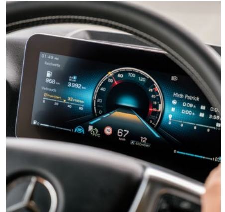
Oben: Zusätzlich zu dem Display hinter dem Lenkrad besitzt der Actros einen Touchscreen, der das bisherige Schalterfeld ablöst.